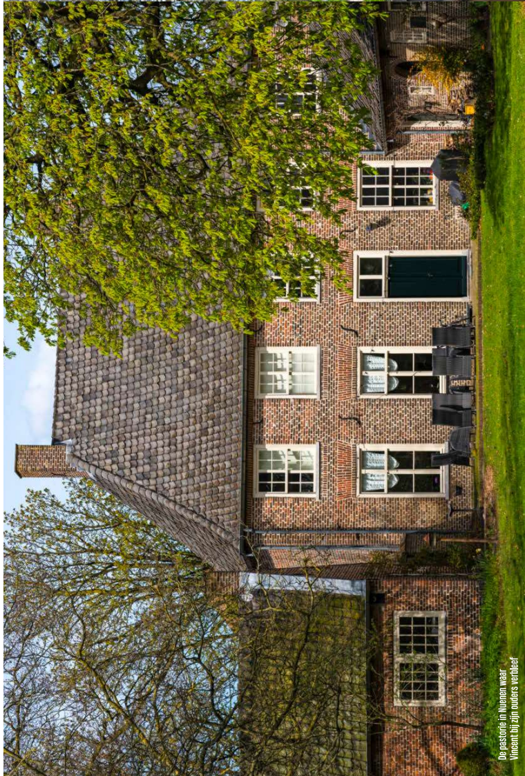
De pastorie in Nuenen waar Vincent zijn ouders verblijf