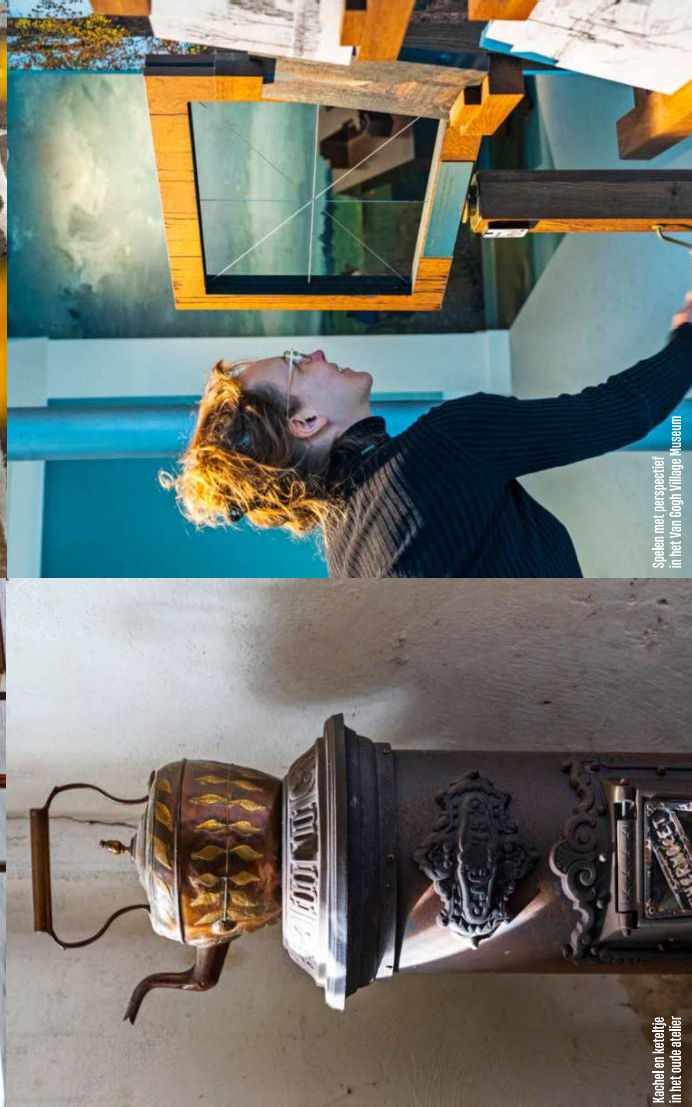
Spelen met perspectief in het Van Gogh Village Museum