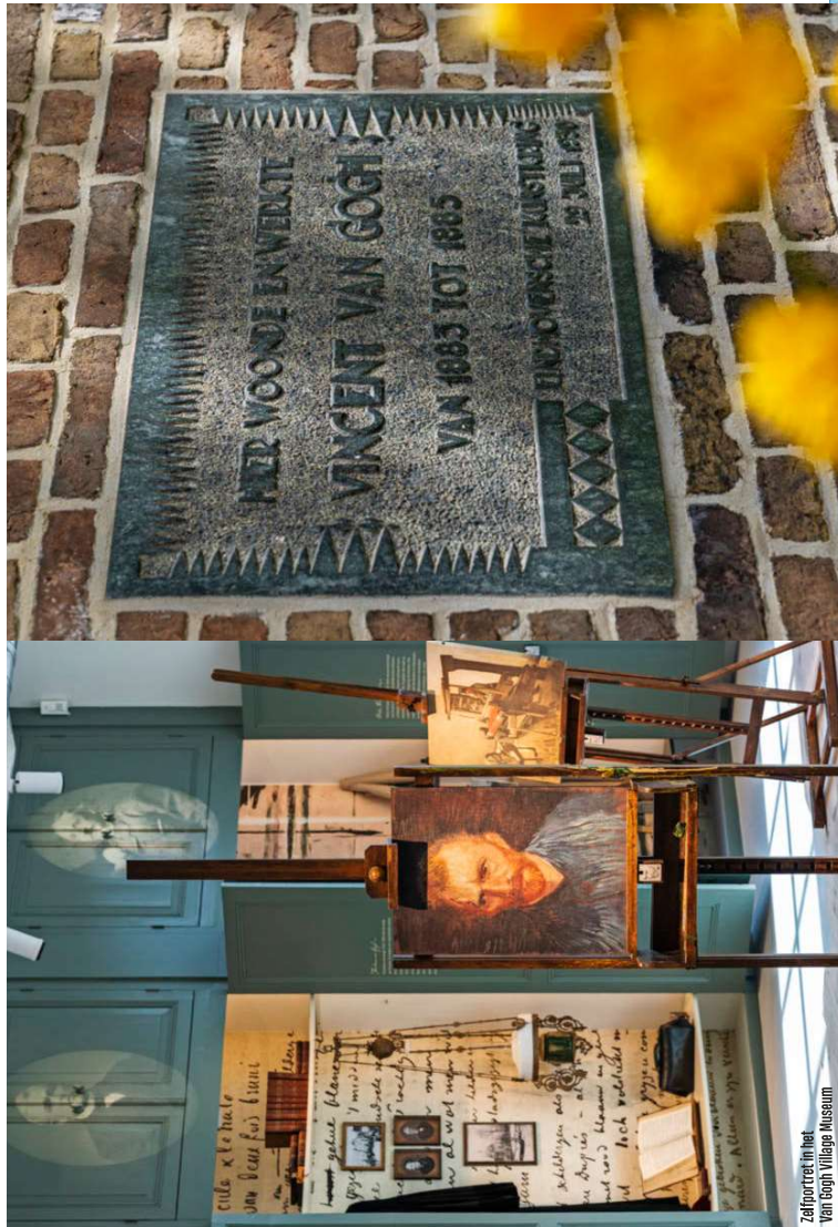
Zelfportret in het Van Gogh Village Museum