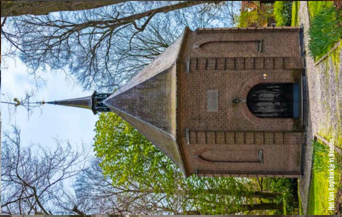
Het Van Goghkerkje in Muiden.