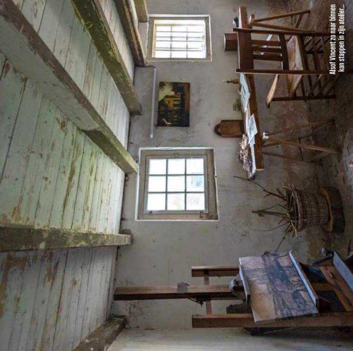
Alsof Vincent zo naar binnen kan stappen in zijn atelier...