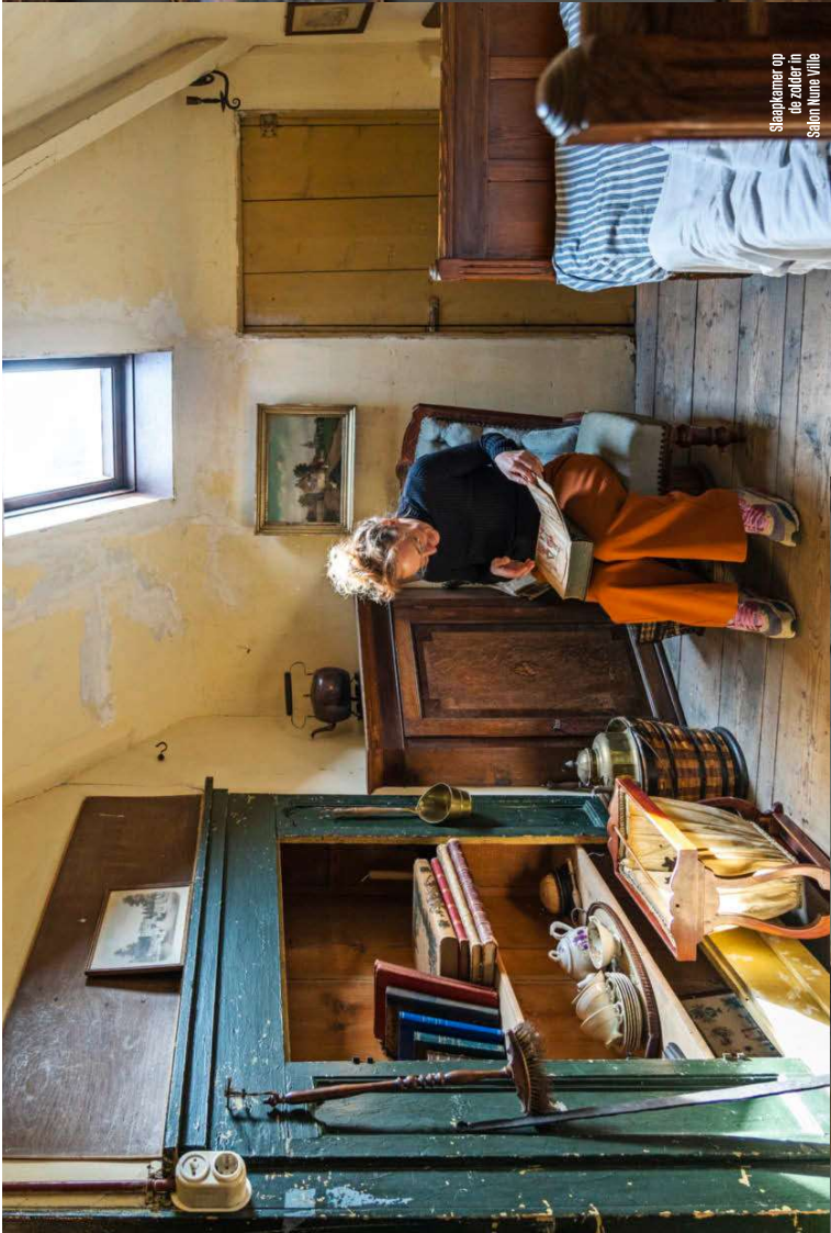
Slaapkamer op de zolder in Salon Nune Ville