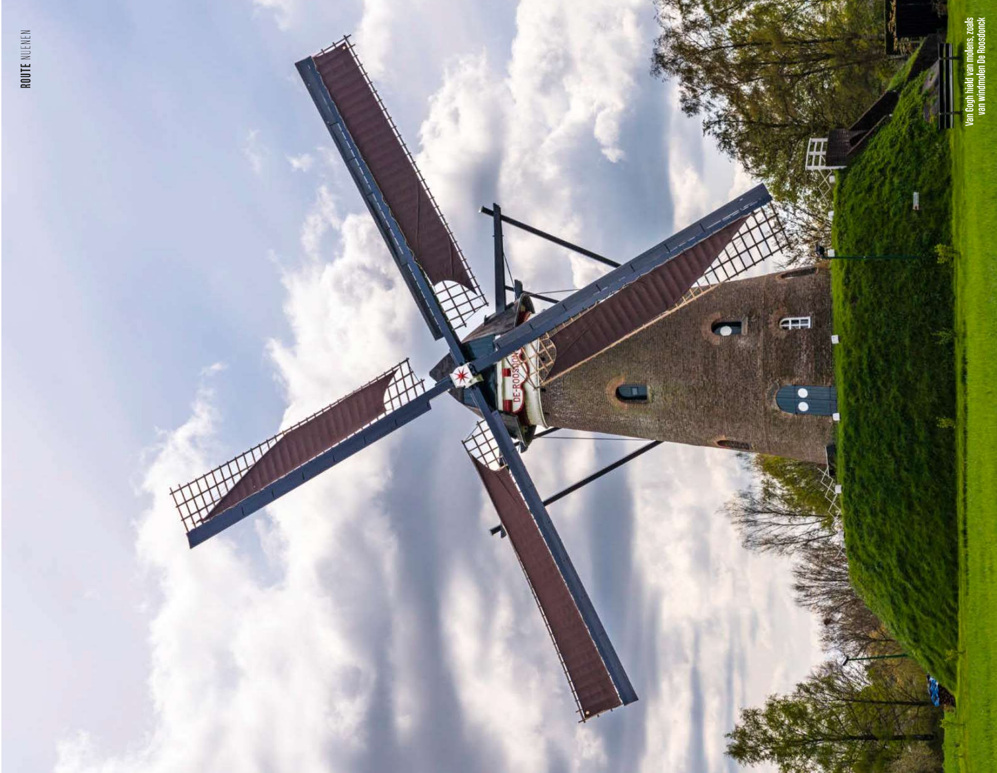
Van Gogh had vier molens, zoals van windmolen De Roosdunck