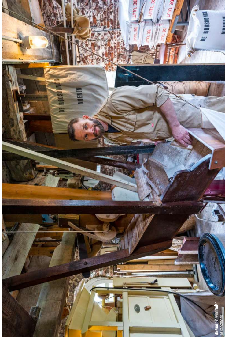
Molenaar in windmolen De Roosdonck

zijn de automobilisten die soms in een rotvaart langs komen rijden, alsof ze de kalmte van het gebied niet aankunnen.