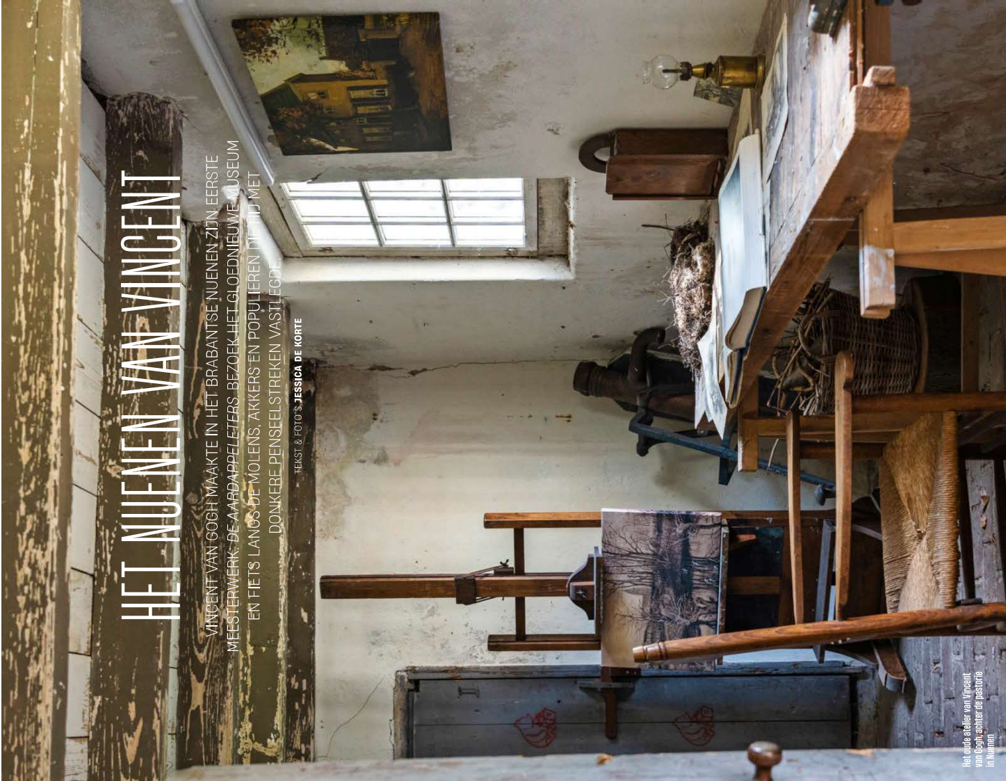
Van Gogh atelier van Vincent van Gogh, zolder de pastorie in Nuienen