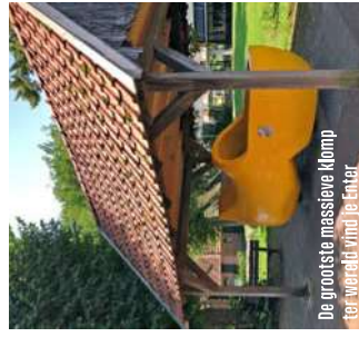
De grootste massieve klomp ter wereld vind je Enter

Die Regge had tot 1900 alle ruimte om zijn eigen weg te zoeken. Tussen de oorsprong bij Diepenheim en de monding in de Overijsselse Vecht bij Ommen was de rivier zo'n 70 kilometer lang. De naam komt van het Latijnse rigare , dat 'bevloeden' en 'overstromen' betekent – ook woorden als 'regen' en 'irrigatie' zijn hier-van afgeleid. Overstromen deed de rivier regelmatig. Aanvankelijk waren de boeren daar heel blij mee. Het slib