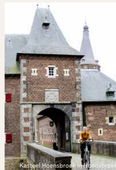
Kasteel Hoensbroek in Hoensbroek.