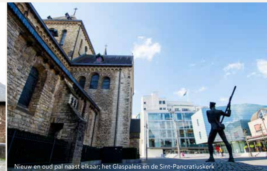
Nieuw en oud pal naast elkaar; het Glaspaleis en de Sint-Pancratiuskerk