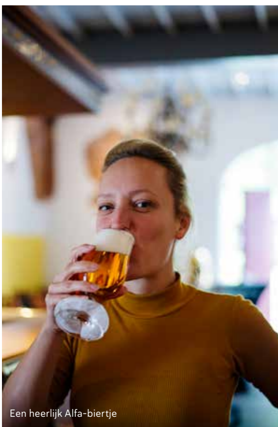
Een heerlijk Alfa-biertje

Tot slot voert de route terug naar Heerlen op een fietspad over een voormalige mijnspoordijk. De mijnindustrie bracht destijds niet alleen veel geld in het laatje, maar liet ook een interessante erfenis voor de fietser achter.